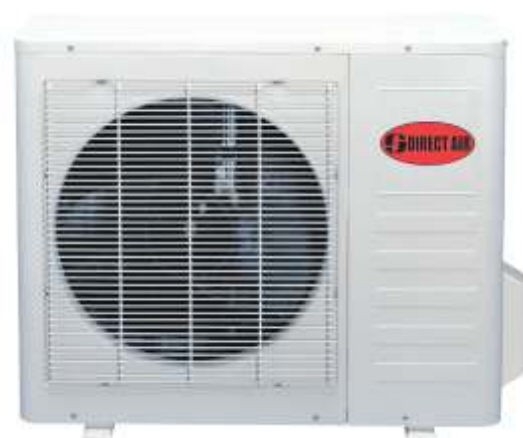
Unité extérieure compacte et silencieuse